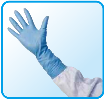
左右兼用 / パウダーフリー